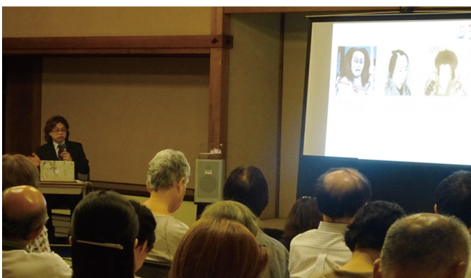
伝統芸能ことはじめ