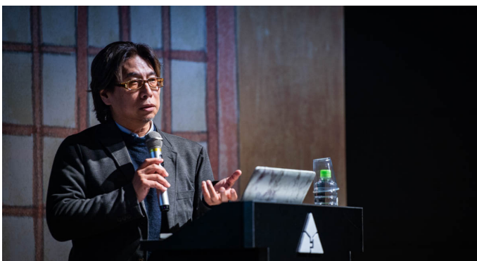
木ノ下歌舞伎の学校ごっこ