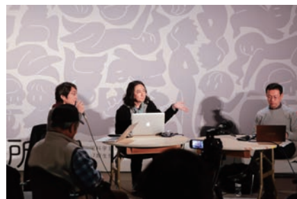
これからの創造のためのプラットフォーム 「映像表現と人類学」