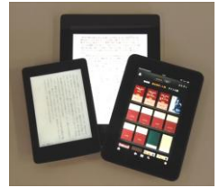
電子書籍リーダー

通学や通勤の電車のなかで書物を広げて読んでいる人は少ない。多くの乗客がスマホを、まるでお位牌を拝むかのような前かがみの姿勢で睨んでいる。スマホ利用者のこれまた多くがLINEでそこにはいない誰かと通信していたり、ゲームでどこにもいない誰かと闘ったりしている。ごくわずかにKindleや青空文庫などの電子書籍リーダーを用いて「読書」をしている人がいると、なんだかうれしくなって、「書物に代わってお礼申し上げます」と最敬礼をしたくもなる。だが、電子書籍はもちろん「物質」としての書物とは何もかもちがっている。雨の降る日の車中で文庫本を広げたときにすべての頁が波打ってしまったものを手にするときのなんとも言えない失望や、大事な頁に付箋を貼るならまだしも、下端を三角形に折ったり、あるいは映画の半券やコンビニのレシートやクリーニング屋の引取票などがはさまっているような、どこまでが書物なのかかわからない呆然とした感覚といったものを味わうことができないのだ。電子書籍は確実に文字情報のみによって脳内に書物の宇宙を流し込んでくれる。そこには、物質としての書物もつ、読書とはおよそ無関係な、いじましさが漂わないのである。